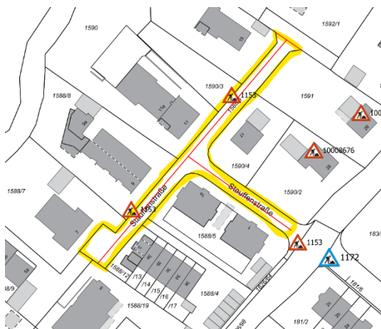
Abb. 1: Stauffenstraße

Die Anwohner werden um Einhaltung der Vollsperrung gebeten, da ein Befahren der vorbereiteten, geplanten Oberfläche eine Asphaltierung unmöglich macht.